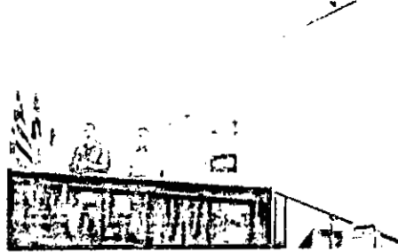
O prefeito Eduardo Braide anuncia intervenções e novas estratégias que serão implementadas com a operação "Asfalto Novo".

O prefeito Eduardo Braide lançou, nesta quinta-feira (2), no auditório do Palácio La Ravardière, a operação "Asfalto Novo". Na ocasião, o gestor anunciou as intervenções e novas estratégias que serão implementadas nas principais vias e corredores da capital com a finalidade de melhorar a qualidade de vida de condutores de veículos e pedestres.